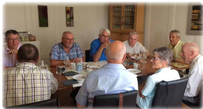
gemütliche Geburtstags-Kaffeerunde im Pfarrhaus am 27. August 2019

Weidweg 1B, Erlinsbach AG 31. Oktober 1927, 92 Jahre